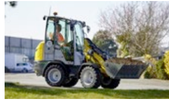
Chargeuses sur pneus