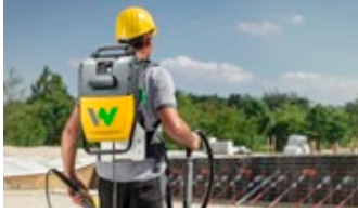
Technique du béton